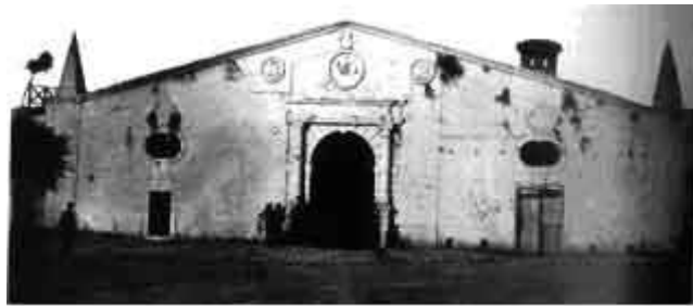
Η Πύλη Του Αγίου Γεωργίου όπως ήταν πριν καταδαριστει

Κατάλαβε ότι τα γατάκια ήταν μοναδικά. Αυτός δεν ήταν ένας συνηθισμένος ληστής, σκέφτηκε. Ούτε εύκολος αντίπαλος ήταν. Το παζλ που τον οδηγούσε να συνθέσει βρισκόταν ακόμα στην αρχή του. Που θα τελείωνε άραγε αυτό το ταξίδι; Επέστρεψε στο γραφείο του και κοίταξε το αρχείο του. Προσπάθησε να θυμηθεί όλα αυτά που χάθηκαν εξαιτίας της αδιαφορίας των πολιτών.