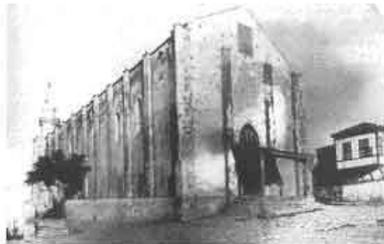
Ο ενετικός ναός του Σωτήρος μετατράπηκε από τους Τούρκους σε τζαμί. Κατά την Τουρκοκρατία ονομαζόταν Βασιδέ τζαμί. Κατεδαφίστηκε από τη στρατιωτική χούντα της 21ης Απριλίου κατά τη διάρκεια της δικτατορίας.

Ένα σχέδιο που θα εφαρμοζόταν για να ωφελήσει τους πολλούς.