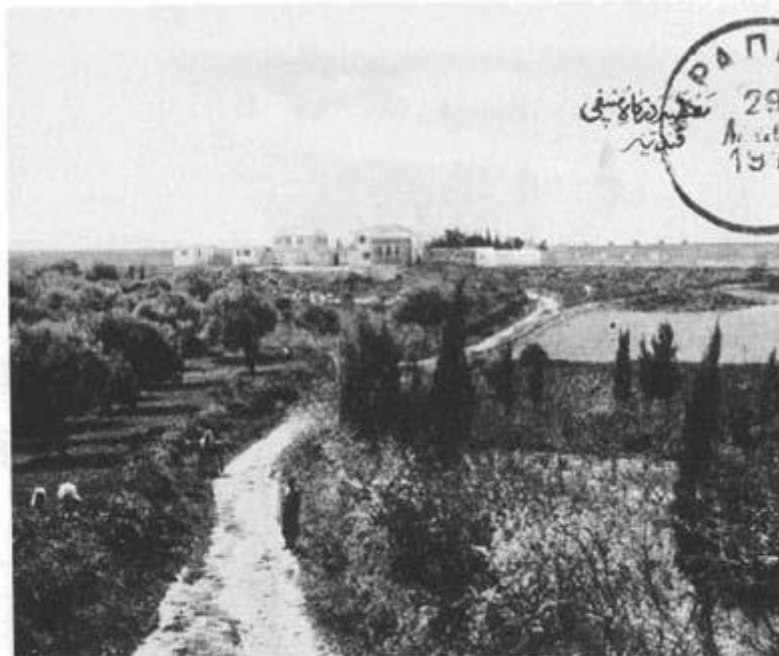
Mastaba - Turkish Convent - Convent turk - Candia Crete

ΜΟΛΟΝΟΤΙ ΑΙ ΥΠΟΘΕΣΕΙΣ ΤΟΥ ΑΝΕΓΕΡΘΕΝΤΟΣ ΤΕΚΕ ΤΩΝ ΤΟΞΟΤΩΝ ΔΙΕΧΕΙΡΙΖΟΝΤΟ ΚΑΙ ΔΙΕΚΑΝΟΝΙΖΟΝΤΟ ΜΕΧΡΙ ΤΟΥΔΕ ΜΕΑΞΥ ΤΩΝ ΠΤΩΧΩΝ ΤΟΞΟΤΩΝ, ΕΝ ΤΟΥΤΟΙΣ ΟΜΩΣ ΚΑΠΟΙΟΣ ΡΕΤΖΕΤ ΚΑΤΕΛΑΒΕ ΚΑΙ ΜΕΤΕΤΡΕΨΕ ΕΙΣ ΤΣΙΦΛΙΚΙΟΝ ΤΟΝ ΤΕΚΕ, ΛΕΓΩΝ ΕΙΣ ΗΜΑΣ. «ΠΗΓΑΙΝΕΤΕ ΕΙΣ ΑΛΛΟ ΜΕΪΝΤΑΝΙ ΝΑ ΡΙΠΤΕΤΕ ΤΑ ΒΕΛΗ ΣΑΣ». ΟΙ ΤΕΚΕΔΕΣ ΗΤΑΝ ΜΟΥΣΟΥΛΜΑΝΙΚΑ ΘΡΗΣΚΕΥΤΙΚΑ ΙΔΡΥΜΑΤΑ. ΟΙ ΜΟΝΑΧΟΙ (ΔΕΡΒΗΣΗΔΕΣ) ΧΡΗΣΙΜΟΠΟΙΟΥΣΑΝ ΕΝΤΟΝΑ ΤΗΝ ΕΚΣΤΑΣΗ ΓΙΑ ΤΗΝ ΕΠΑΦΗ ΜΕ ΤΟ ΘΕΟ.